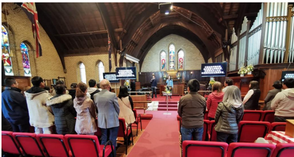
下午 4 點國語堂的第一次聚會

澳亞基督教會的國語堂與一些上午 11 點國語堂的弟兄姐妹，一起參加了新建立的下午 4 點國語堂。他們開始相互瞭解並開始邀請朋友和家人來參加這個新的分堂。